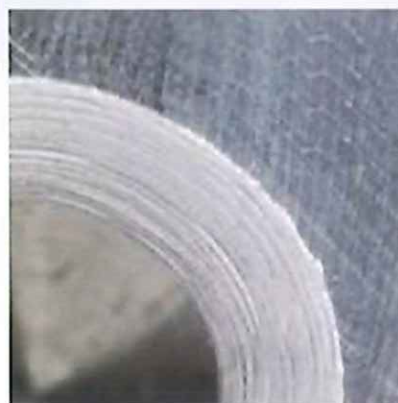
一般工具での加工面